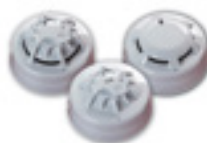
Hasta 20 detectores de fuego/ calor por zona