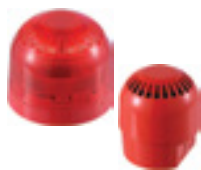
Sirenas y balizas, opciones de área segura, intrínsecamente seguras o a prueba de llama