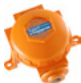
Detectores de gases estándar de la industria