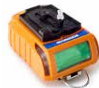
Ansaugadapter mit Pumpe